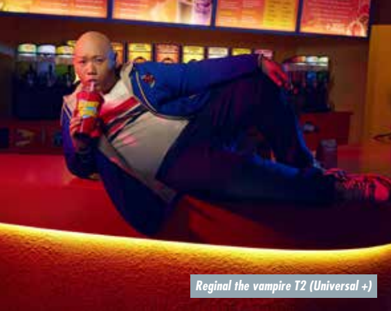
Reginald the vampire T2 (Universal +)