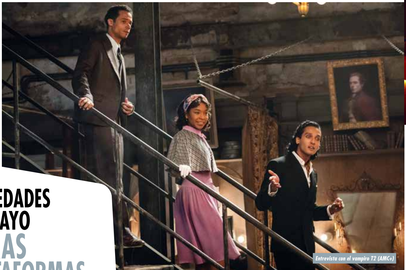
Entrevista con el vampiro T2 (AMC+)