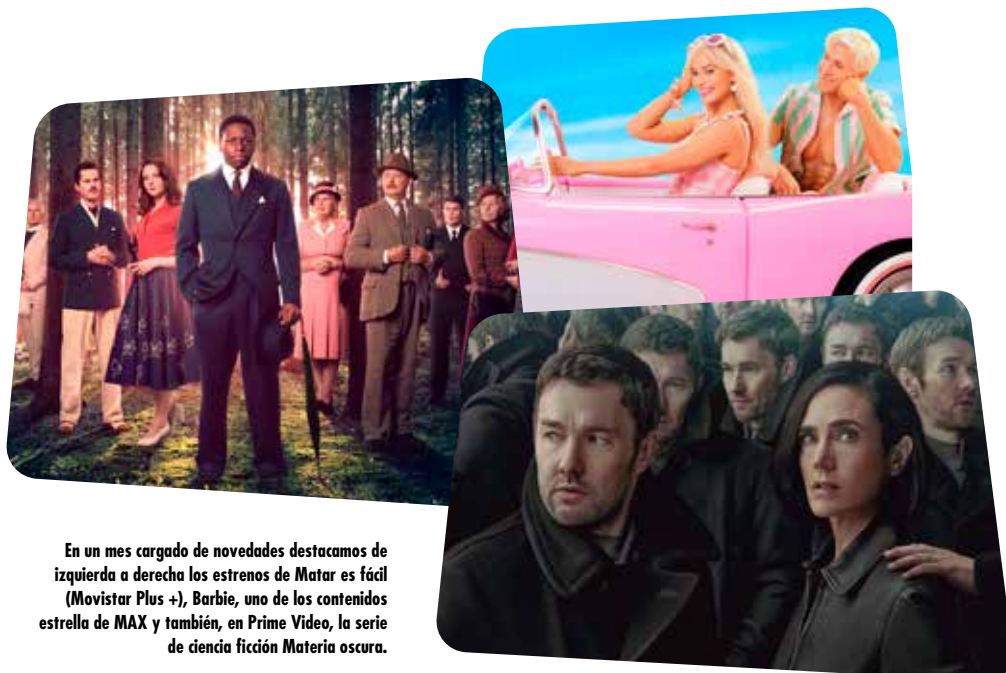
En un mes cargado de novedades destacamos de izquierda a derecha los estrenos de Matar es fácil (Movistar Plus +), Barbie , uno de los contenidos estrella de MAX y también, en Prime Video, la serie de ciencia ficción Materia oscura .

Este símbolo indica los títulos disponibles en el catálogo, que seleccionamos para ti y que te sugerimos descubrir.