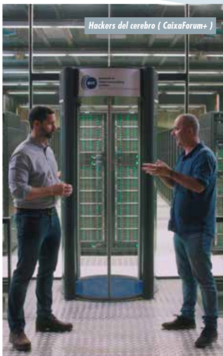
Hackers del cerebro (CaixaForum+)

Nueva serie de animación infantil para toda la familia. Kipo y la era de las bestias mágicas llega a DreamWorks. Desde el lunes 6 de mayo y de lunes a viernes a las 20:35 h., con episodios