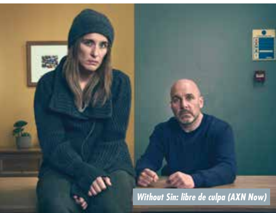
Without Sin: libre de culpa (AXN Now)

Cuenta en seis episodios la juventud de esta mujer, libre y osada, convertida en un icono mundial. Creada por Danièle Thompson y Christopher Thomson, se centra en su ascenso al estrellato. Se verá el 30 de mayo (22:30 h.) en SundanceTV.