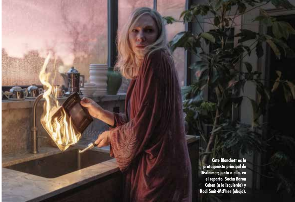
Cate Blanchett es la protagonista principal de Disclaimer ; junto a ella, en el reparto, Sacha Baron Cohen (a la izquierda) y Kodi Smit-McPhee (abajo).

¿Conoces bien a las personas que te rodean? Y, si es así, ¿cuánto tiempo hace falta para cambiar tu idea y percepción de esas mismas personas? He aquí algunas de las preguntas que se filtran entre los pliegues de la narrativa de Disclaimer , la serie dirigida por Alfonso Cuarón, ganador de dos Premios Oscar al mejor director ( Gravity y Roma ). Tras estrenarse en la sección Fuera de Concurso en la 81.ª edición del Festival Internacional de Cine de Venecia, llega a Apple TV+ el 11 de octubre con los dos primeros episodios. El resto se incorpora a ritmo semanal. Esta adaptación de la novela Disclaimer que Renée Knight escribió en 2015 nos presenta un thriller psicológico cuyo personaje protagonista está interpretado por la también ganadora de dos estatuillas, Cate Blanchett. La actriz, premiada en 2005 por El aviador y en 2014 por Blue Jasmine , interpreta el papel de la aclamada periodista y documentalista Catherine Ravenscroft, que se ha hecho un nombre revelando delitos y transgresiones de otros. Sin embargo, su reputación peligra al recibir una novela de un autor desconocido que la horroriza y pone su