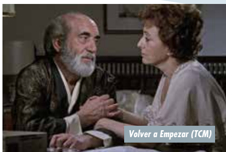
Volver a Empezar (TCM)

muchos fans de este terrorífico universo a visitar nuestro país.