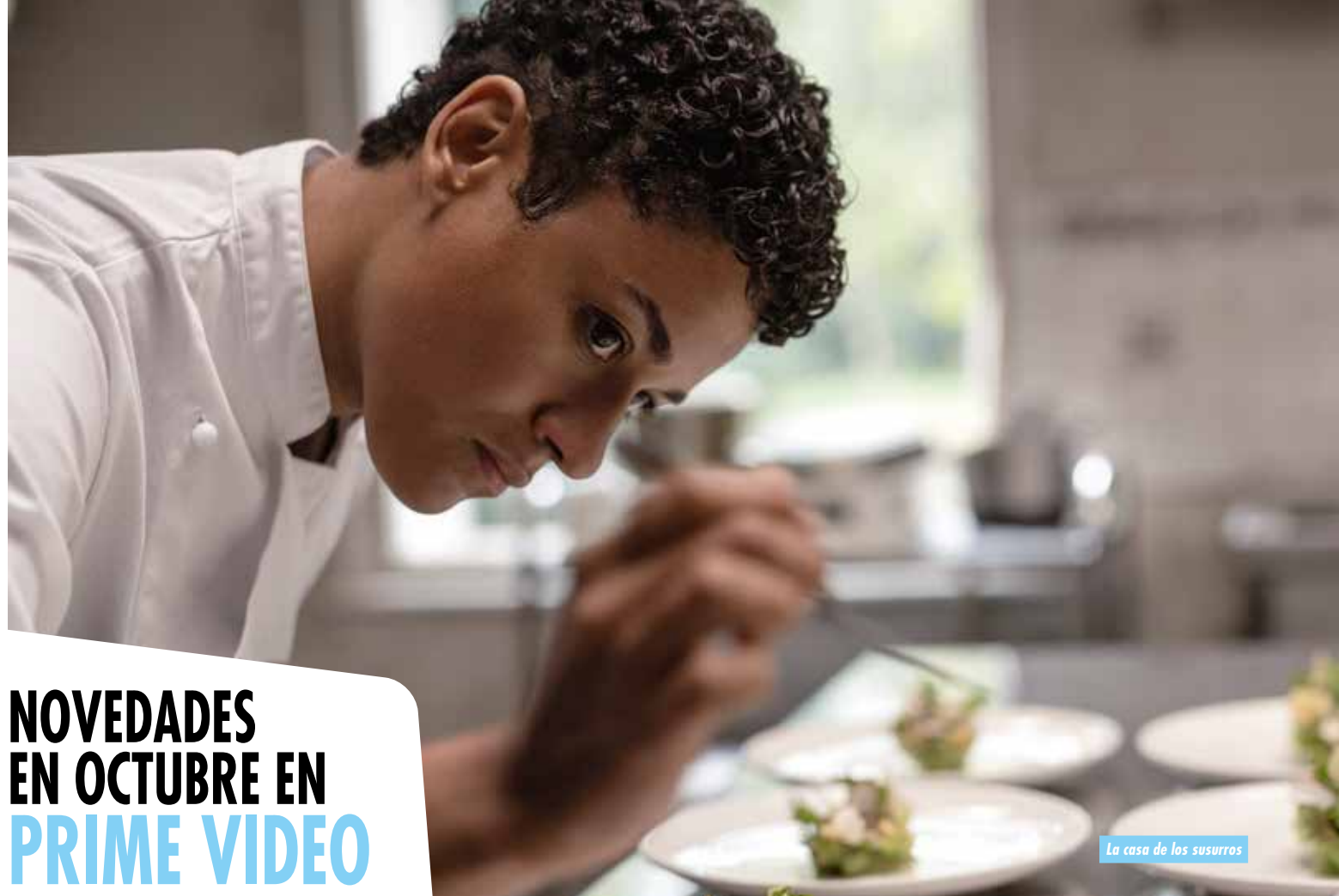
La casa de los susurros