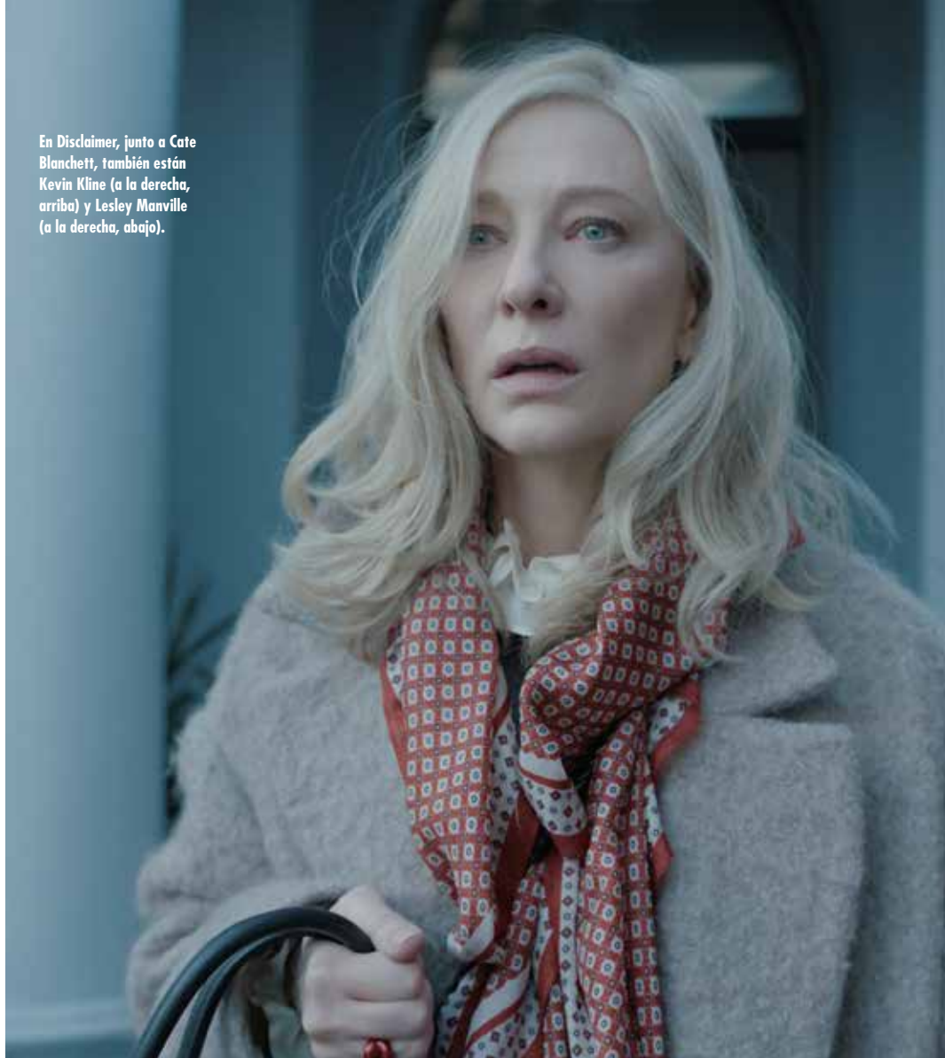
En Disclaimer, junto a Cate Blanchett, también están Kevin Kline (a la derecha, arriba) y Lesley Manville (a la derecha, abajo).

La primera víctima de esta actitud es el personaje de Catherine, sobre cuyo pasado se proyecta una luz que arroja una sombra inquietante, un lado oscuro. “Esa es la parte que más disfruté, poder explorar este lado de ella” , explicó Blanchett. “Pensamos que las personas que no lo cuentan todo tienen algo que ocultar. Yo a eso lo llamo privacidad. Las personas que son muy reservadas no son necesariamente deshonestas, todo el mundo tiene cosas que ocultar, sean muchas o pocas, quizá para procesarlas por nuestra cuenta y no porque estén mal” . Y añade: “Interpreto a una mujer que ha enterrado recuerdos traumáticos,