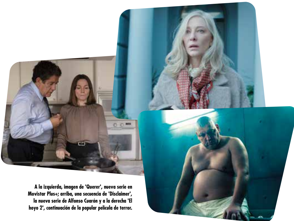
A la izquierda, imagen de 'Querer', nueva serie en Movistar Plus+; arriba, una secuencia de 'Disclaimer', la nueva serie de Alfonso Cuarón y a la derecha 'El hoyo 2', continuación de la popular película de terror.