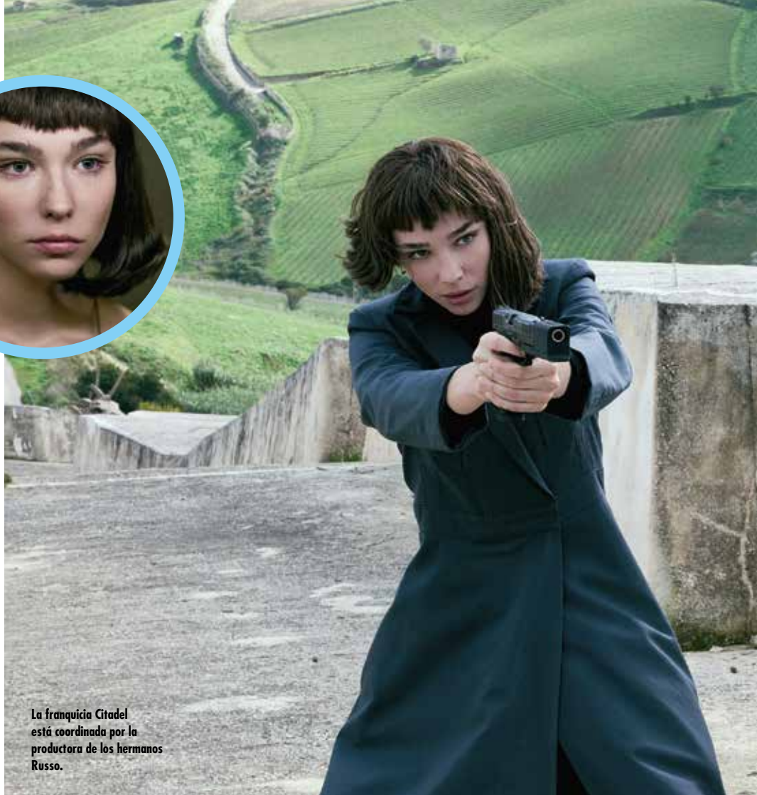
La franquicia Citadel está coordinada por la productora de los hermanos Russo.