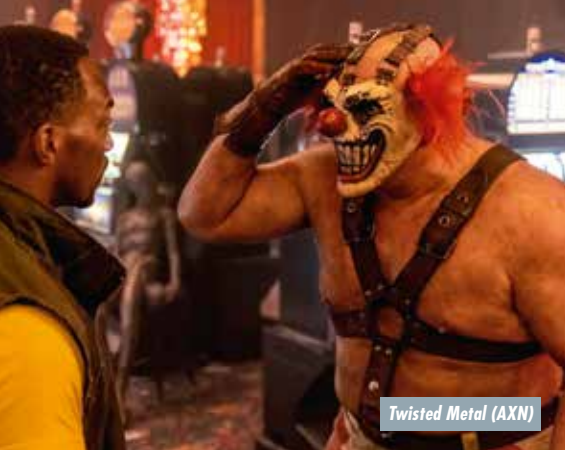
Twisted Metal (AXN)