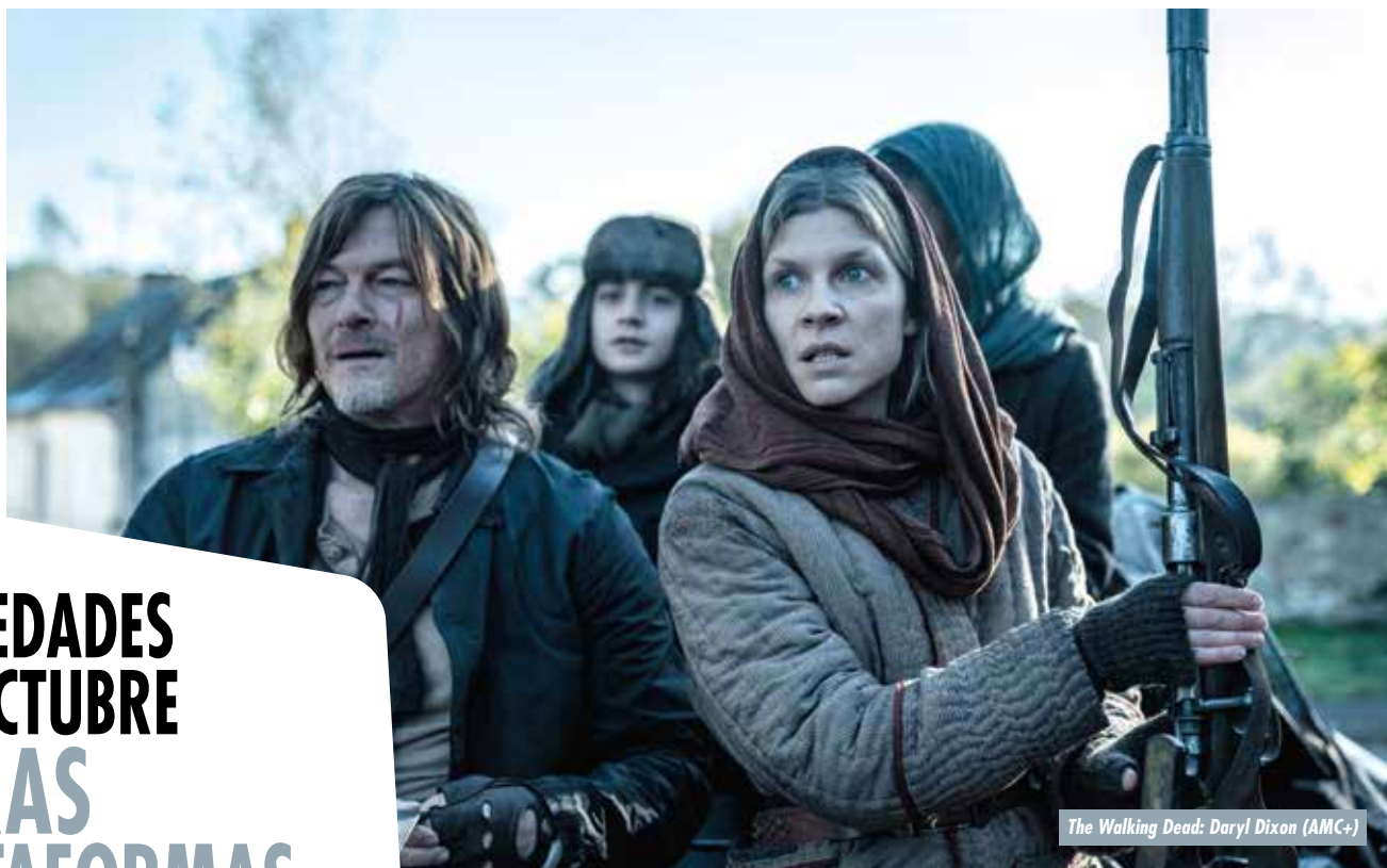
The Walking Dead: Daryl Dixon (AMC+)

N uevo capítulo en la historia de Daryl Dixon. La segunda temporada de esta popular serie, que está ambientada en el universo de The Walking Dead y sigue a dos de sus personajes más icónicos en su periplo por Europa, se estrena en exclusiva por AMC+ el próximo 3 de octubre. Subtitulada The Walking Dead: Daryl Dixon – The Book of Carol , en los nuevos capítulos la actriz Melissa McBride retoma el papel de Carol Peletier y se une a Daryl