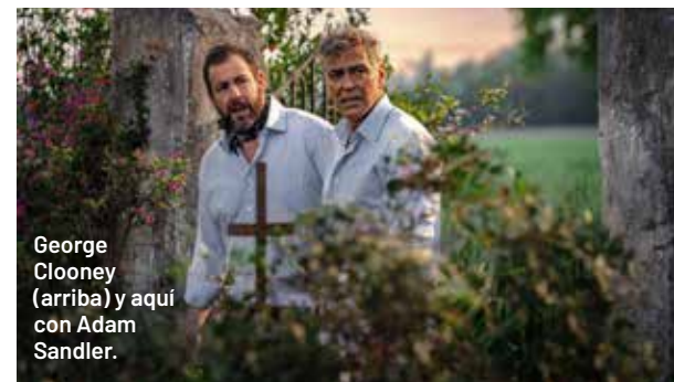
George Clooney (arriba) y aquí con Adam Sandler.

Como sucede en sus mejores películas, Baumbach coescribe (aquí con Emily Mortimer) y dirige un reparto que revela la fragilidad de todos los personajes, no sólo del protagonista. Junto a Clooney y Sandler, encontramos a Laura Dern, Billy Crudup, Riley Keough, Greta Gerwig y Alba Rohrwacher, todos atrapados en un laberinto de relaciones disfuncionales, pero profundamente humanas. Y en el corazón de la película reside el verdadero conflicto: el que existe entre la presencia en pantalla y la ausencia emocional, entre la carrera y la familia. La hija mayor de Jay lo acusa de no haber estado nunca presente para ella. Su antiguo compañero